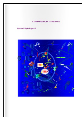
“Farmacologia Integrada: 4ª edição especial”