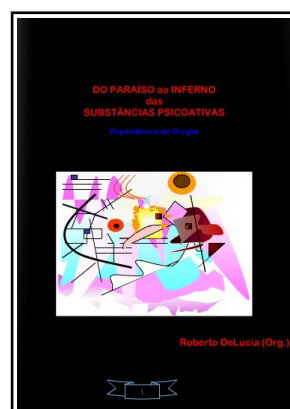
“Do Paraíso ao Inferno das substâncias psicoativas”