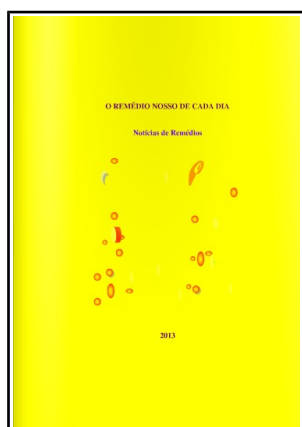
“O remédio nosso de cada dia”